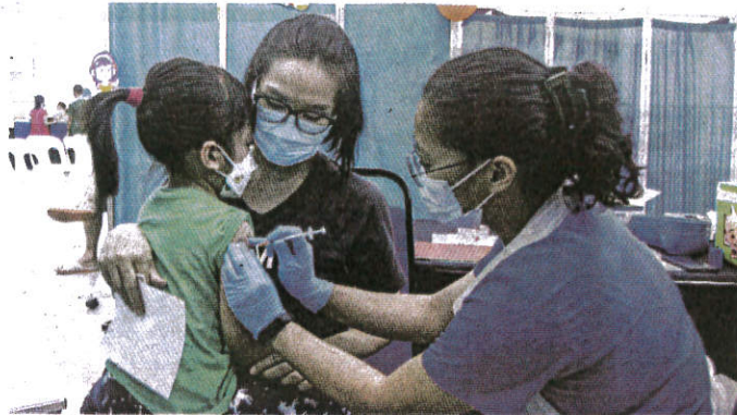
Tingkat kesedaran ibu bapa untuk memastikan anak berusia lima hingga 11 tahun dapat suntikan vaksin.