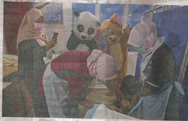
Maskot kartun popular, Mickey Mouse dan Panda membuat aksi ceria ketika seorang kanak-kanak menerima suntikan vaksin COVID-19 pada Program Imunisasi Kanak-Kanak (PICKKids) di Pusat Perubatan Mawar (MMC).

Dalam pada itu, seramai 15,908,442 individu dewasa atau 67.6 peratus telah menerima suntikan dos peng-