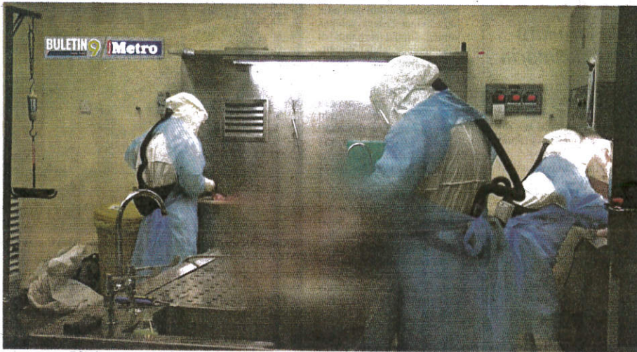
SAMPEL tisu dalam turut diambil bagi mengesan keradangan otot jantung atau miokarditis.

Sejumlah 460 laporan kes kematian disyaki selesai penyiasatan