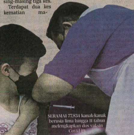
SERAMAI 77,834 kanak-kanak berusia lima hingga 11 tahun melengkapkan dos vaksin Covid-19

Putrajaya mencatatkan angka kematian tertinggi iaitu enam kes, diikuti Johor, Kedah dan Sarawak masing-masing empat kes, Pahang dan Perak masing-masing tiga kes.