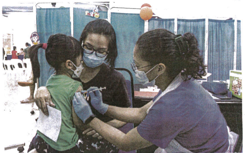
A mother helping her daughter receive a dose of the Covid-19 vaccine at the Da Men Mall Off-Site Vaccination Centre in Subang Jaya yesterday.

557 people were discharged from the hospitals.